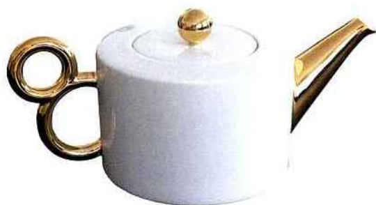
TABLE & DÉCO